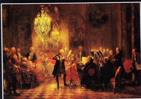
Federico il Grande

Nato a Milano nel 1970, si diploma in Flauto nel 1990 presso il Conservatorio B. Marcello di Venezia e si perfeziona poi con M. Larrieu. Successivamente si dedica allo studio del flauto barocco, classico e rinascimentale sotto la guida di K. Kaiser, M. Hantai, M. Root ed altri. Collabora regolarmente con i più prestigiosi gruppi barocchi e con direttori di fama mondiale, sia in qualità di primo flauto che di solista. Ha dato concerti in tutta Europa esibendosi per i festival più importanti e le maggiori stagioni concertistiche. Ha al suo attivo numerose incisioni discografiche per le etichette Decca, Naïve, Winter & Winter, Teldec, Chandos, Stradivarius, Amadeus così come registrazioni ed interviste radiofoniche per WDR, RTSI, RAI e Radio France. Nell'anno accademico 1996-97 si è diplomato in Storia e Didattica della Musica presso la Scuola di Paleografia e Filologia Musicale di Cremona, votazione 70/70 cum laude, con una tesi specifica sul flauto traverso. Si dedica regolarmente all'insegnamento del flauto traverso barocco, classico e moderno. Dal 2005 viene invitato a tenere Masterclass sul flauto barocco presso vari Conservatori ed istituzioni musicali.